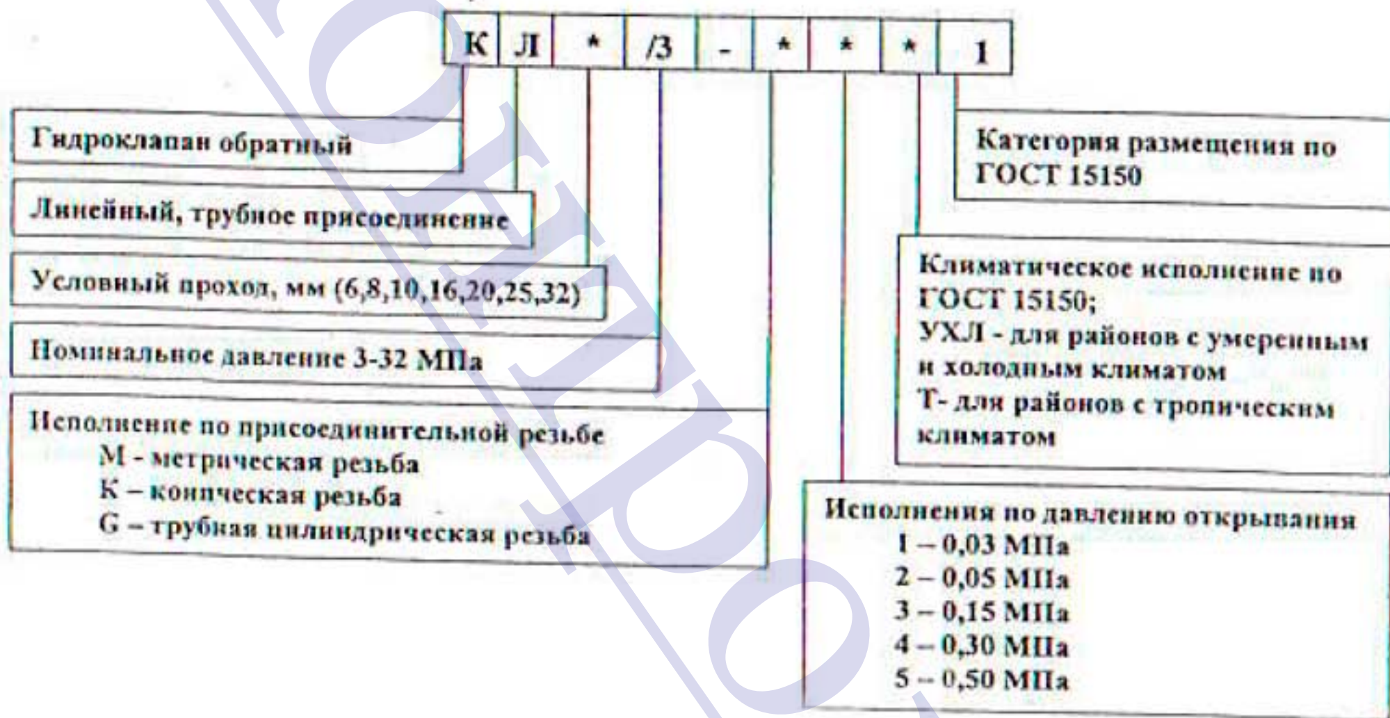
Рисунок 1 - структура условного обозначения